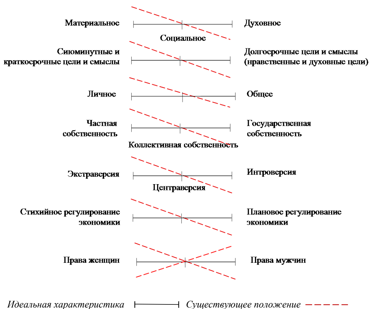
Рис. 1. Дисбалансы современного российского общества

гражданского общества и рынка, в частности территориальных и территориально-экономических общин [12, 15]. На протяжении 8 лет функционирует общественно-патриотический клуб «Третий Рим» на базе гимназии №44 [4]. С 2009 года функционирует учрежденный учеными, предпринимателями, представителями законодательной власти, православной церкви и СМИ Российский центр социальных исследований и просвещения им. С.Н. Булгакова. С 2011г. планируется начало деятельности клуба ученых и предпринимателей «Благородное собрание». Предложения указанных институтов по формированию оптимальной институциональной среды для динамичного и стабильного социально-экономического развития региона были приняты Ивановской городской Думой и администрацией города в утвержденной программе социально-экономического развития [9].