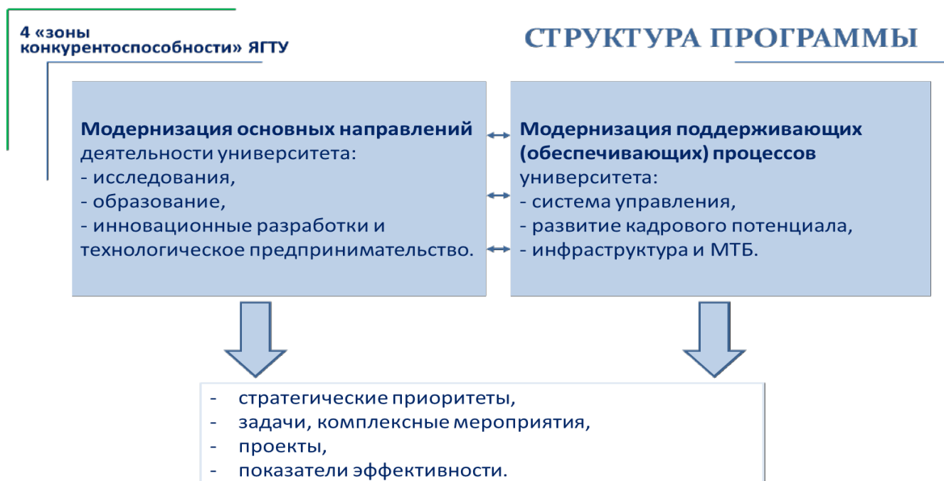
Схема 2. Структура Программы развития ЯГТУ.

Достижение стратегической цели и решение задач Программы развития будет обеспечено посредством модернизации основных направлений деятельности университета (исследования, образование, инновационные разработки и технологическое предпринимательство) и модернизации поддерживающих (обеспечивающих) процессов университета (Схема 2).