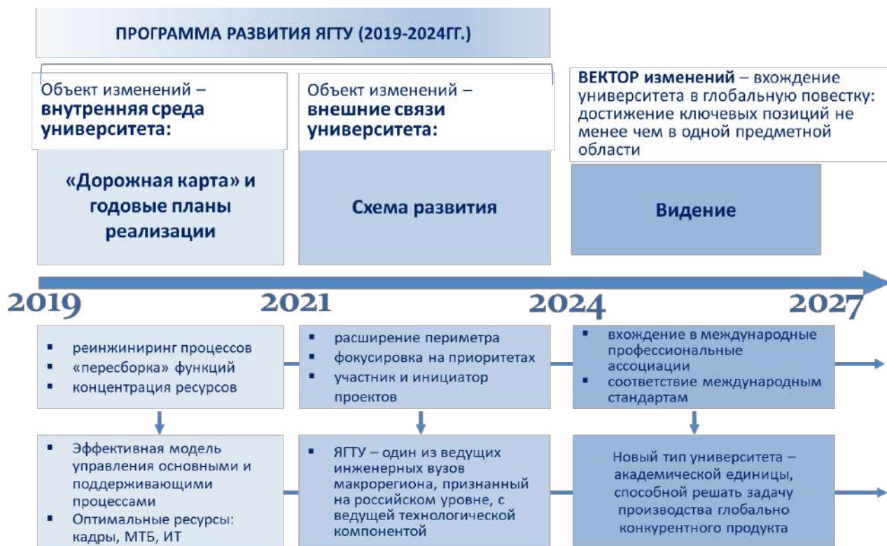
Схема 1. Поэтапная трансформация целевой модели ЯГТУ.

Стратегическая цель Программы развития: добиться существенного изменения состояния университета и увеличение его вклада в развитие Ярославской области, Российской Федерации через поэтапную трансформацию целевой модели ЯГТУ (Схема 1).